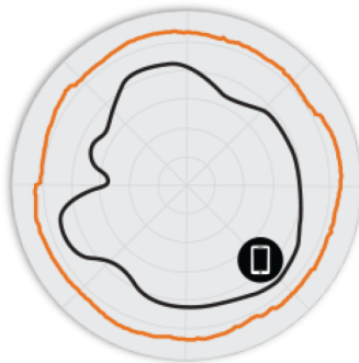
Figure 3. Diagrammes d'antennes Azimut T750 5 GHz