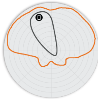
Figure 4. Diagrammes d'antennes Élévation T750 2,4 GHz